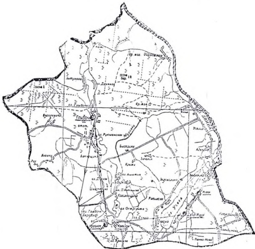
Карта-схема сбора, вывоза и размещения коммунальных отходов Глыбочанского сельского совета Ушачского района