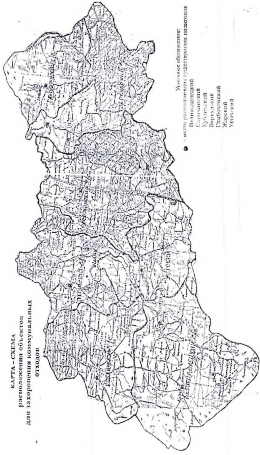
КАРТА - СХЕМА расположения объектов для захоронения коммунальных отходов

Условные обозначения: ● - место расположения существующих полигонов Сорокинский Кузнецкий Верхотурский Губоитовский Жарский Ушачский