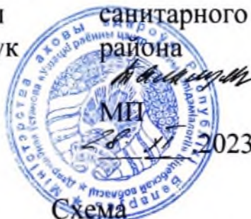
Схема обращения с коммунальными отходами Ушачского районного исполнительного комитета

Сведения о районном, городском, районном в городах, поселковом, сельском исполнительном и распорядительном органе: