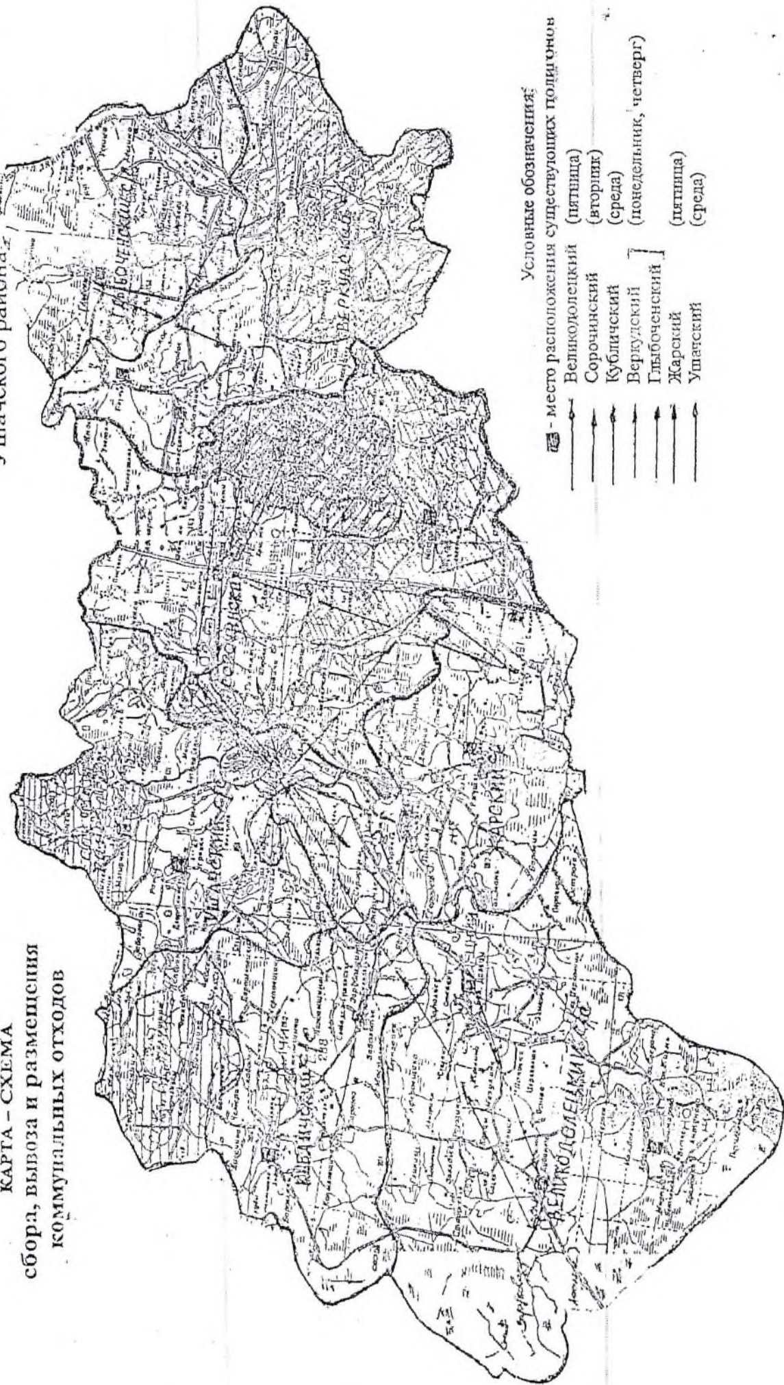
КАРТА - СХЕМА сбора, вывоза и размещения коммунальных отходов

Приложение 3 к схеме обращения с коммунальными отходами, образующимися на территории Ушацкого района